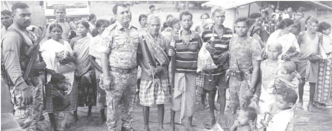
കീഴടങ്ങിയ നക്സലുകൾ പോലീസിനൊപ്പം