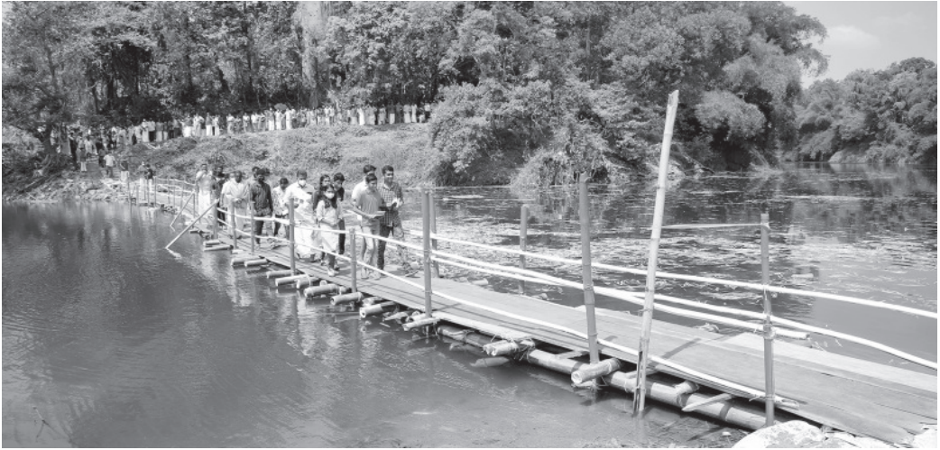
കോമളം പാലത്തിന്റെ ഉദ്ഘാടന ചടങ്ങ്