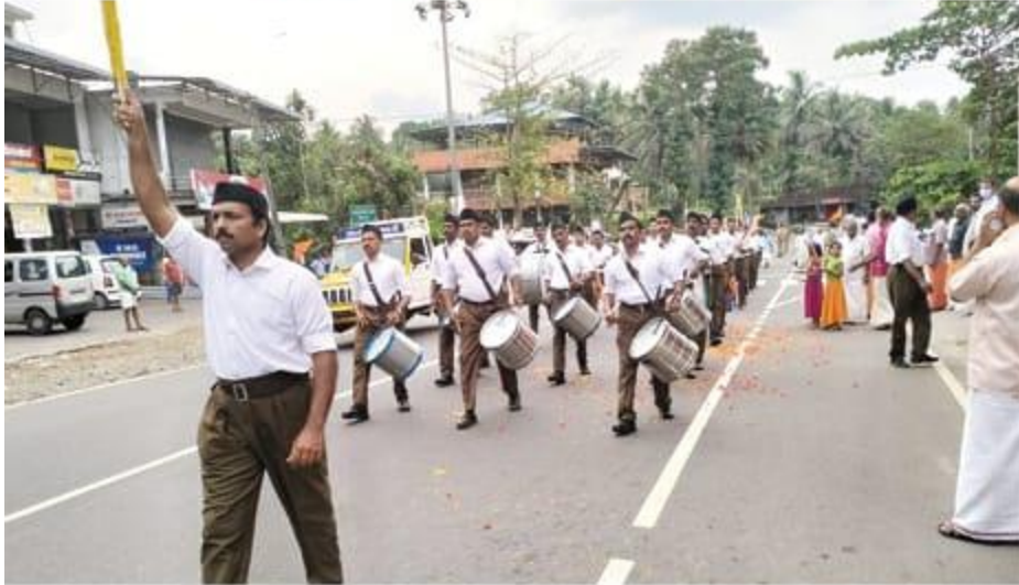
📌 രാഷ്ട്രീയ സ്വയംസേവക സംഘം പുത്തൂർ ഖണ്ഡിന്റെ ആഭിമുഖ്യത്തിൽ നടത്തിയ പഥസഞ്ചലനം