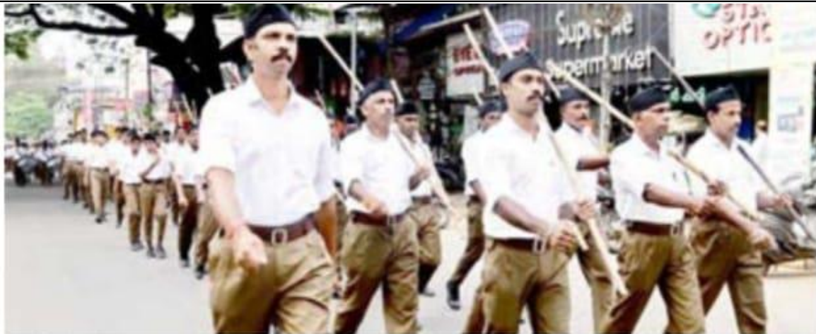
വിജയശക്തി സംഗമത്തോടനുബന്ധിച്ച് കൊടുങ്ങല്ലൂരിൽ നടന്ന പാദസഞ്ചലനം

KERALA KAUMUDI EPAPER Clipping Kerala Kaumudi - Kannur