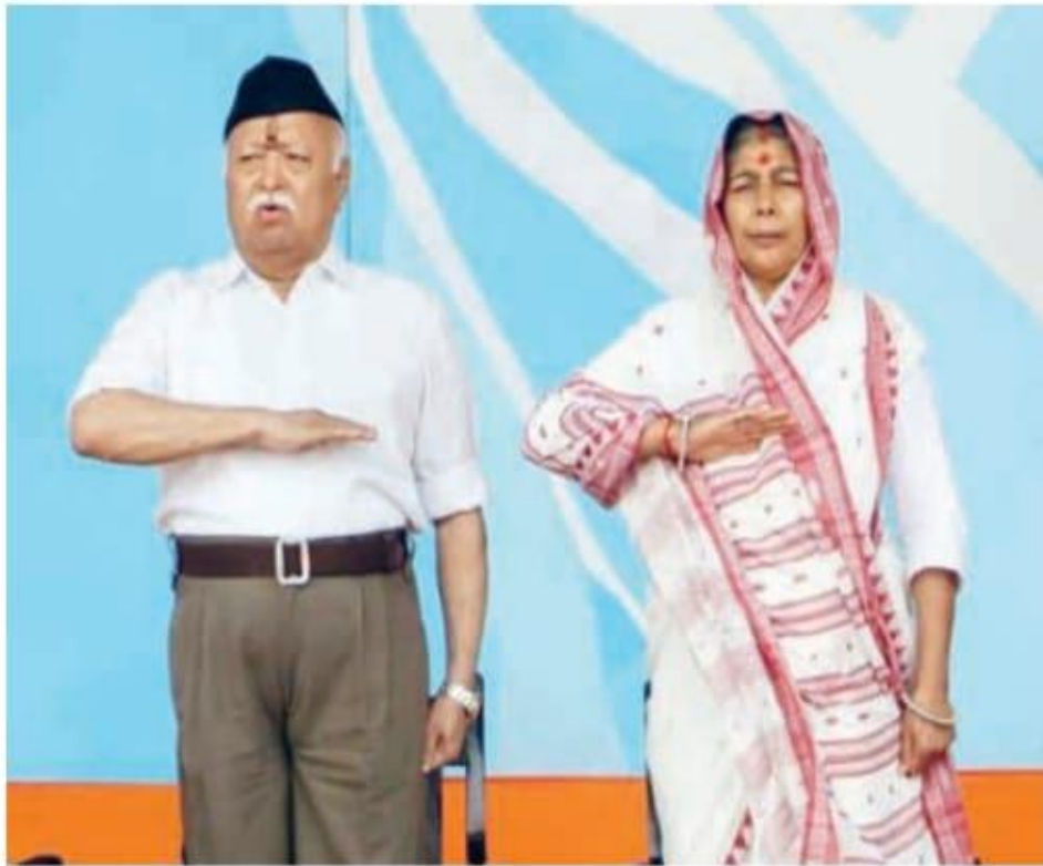
നമസ്കര സദാ വാത്സരേ... നാഗ്പൂരിലെ ആർഎസ്എസ് വിഭവശക്തി മഹോത്സവത്തിൽ സർസംഘചാലക് ഡോ. മോഹൻ ഭാഗവത്. പദ്മശ്രീ ബോധു പ്രശസ്ത പർവ്വതരാജകുമാര സന്തോഷ് യാദവ് പ്രാർത്ഥന ചെയ്യുന്നു

സാമൂഹിക സമത്വമില്ലാതെ യഥാർത്ഥ മാറ്റമുണ്ടാകില്ല. അ സമത്വത്തിന്റെ മൂല കാരണം മതസ്തിയും സാമൂഹിക വ്യവസ്ഥയിലും പൊതുമാറ്റത്തിലും മാണ്. ഭക്ഷണങ്ങളും ജലസേചനങ്ങളും തദ്ദേശങ്ങളും എല്ലാ ഹിന്ദുക്കൾക്കും തുറന്നുകൊടുക്കുന്നില്ലെങ്കിൽ, വളർത്തിയെടുക്കുന്നവർക്ക് അതിലും സമത്വമില്ലെങ്കിൽ സമത്വമെങ്ങനെ ഉണ്ടാകുമെന്ന് സർസംഘചാലക് ചോദിച്ചു. ചുഷണമില്ലാത്തതും നമ്മുടെ പാതവ്യതിരിൽ അധിഷ്ഠിതമായതുമായ വികസനം കൈവരിക്കാൻ ചുഷണ പ്രവണത സമാജത്തിൽ നിന്ന് ഇല്ലാതാക്കേണ്ടതുമാണ് അദ്ദേഹം കൂട്ടിച്ചേർത്തു. സമത്വത്തിന്റെ കാലാവരണപ്പെട്ട സമ്പ്രദായങ്ങളെ ഉപേക്ഷിച്ച്, പാതവ്യതിരി, സമാജിക യാഥാർത്ഥ്യങ്ങളും തമ്മിൽ ഓരോ