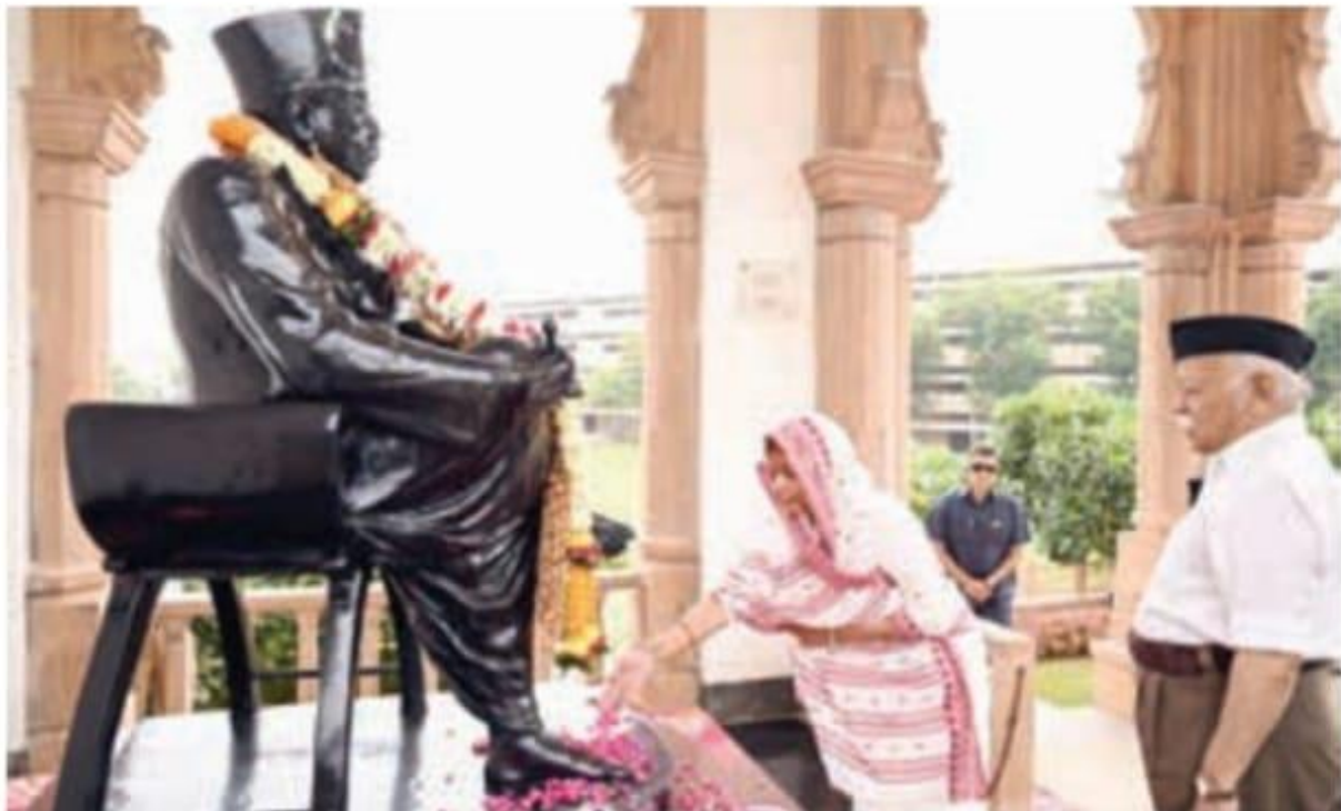
നാഗ്പൂരിൽ വിജയദശമി മഹോത്സവത്തിൽ പങ്കെടുക്കാനെത്തിയ പർവതാരോഹക പദ്മശ്രീ സന്തോഷ് യാദവ് ആർഎസ്എസ് സ്ഥാപകൻ ഹെഡ്ഗേവാനിന്റെ പ്രതിമയിൽ പുഷ്പാർച്ചന നടത്തുന്നു. സർസംഘചാലക് ഡോ.മോഹൻ ഭാഗവത് സമീപം