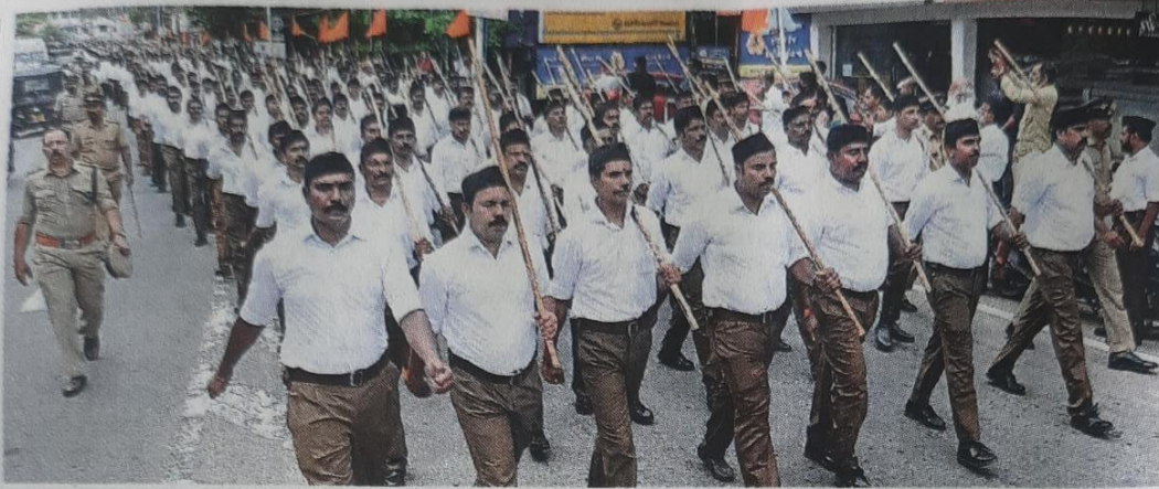
വിജയദശമി ദിനത്തിൽ ആർ.എസ്.എസ് നഗരത്തിൽ നടത്തിയ പഥസഞ്ചലനം