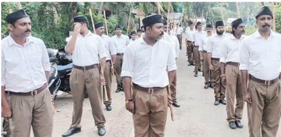
▶ മണിമലയിൽ നടന്ന ആർ.എസ്.എസ്. പാസഞ്ചലനം