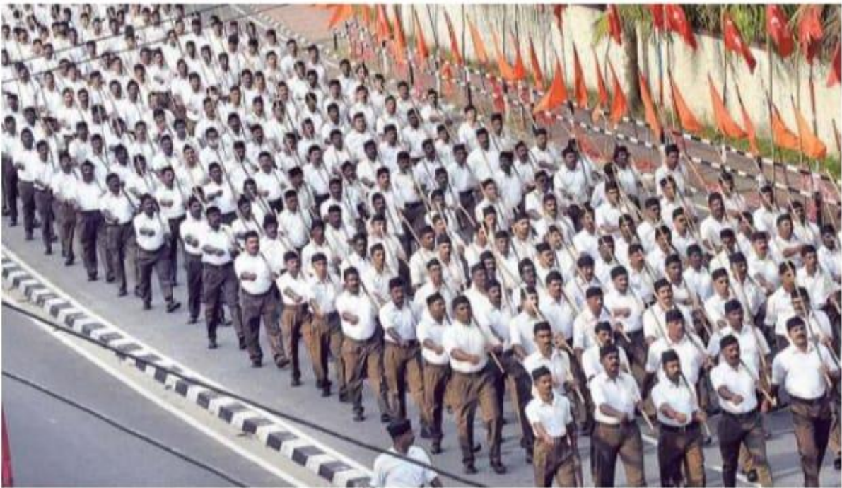
In unison: A route march organised by the Rashtriya Swayamsevak Sangh in Thiruvananthapuram on the occasion of Vijayadashami on Wednesday. S. MAHINSHA