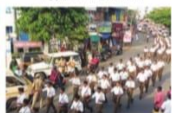
കോട്ടയം അതിർത്തി പാലം