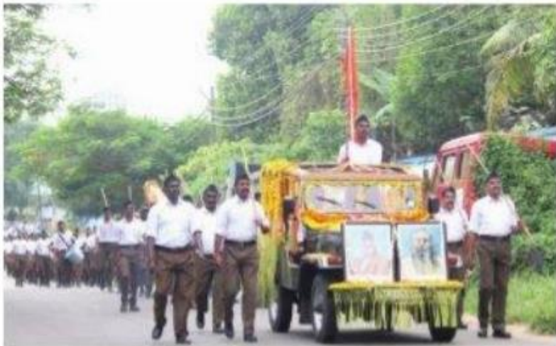
ഏലൂർ ഫാക്ട് മൈതാനത്ത് ആർ.എസ്.എസ് കടുങ്ങല്ലൂർ ഖണ്ഡിന്റെ നേതൃത്വത്തിൽ നടന്ന മഹാ പമസഞ്ചലനം