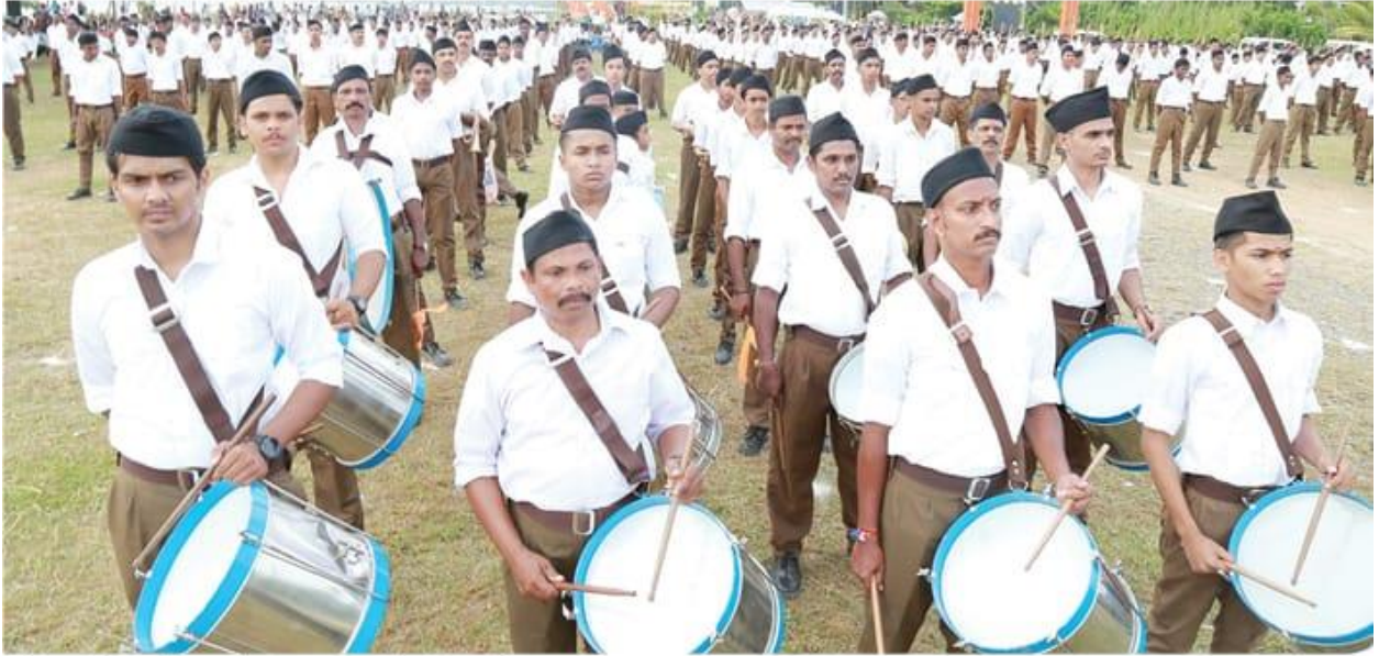
ആർ.എസ്.എസ്. വൈക്കത്ത് നടത്തിയ പരസഞ്ചലനം