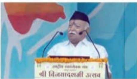
നാഗ്പൂരിൽ നടന്ന ആർഎസ്എസ് വിഭവശക്തി മഹോത്സവത്തിൽ സർസംഘചാലക് ഡോ. മോഹൻ ഭാഗവത്

ഇതര എല്ലാത്തിന് അനുസരിച്ച് വിഭവശക്തിയോടുകൂടിയാണ് അത് ചെയ്യേണ്ടതെന്ന് സർസംഘചാലക് അദ്ദേഹം ചർച്ച ചെയ്തു. മഹാത്മാഗാന്ധിജിയുടെ സ്മരണയോടുകൂടിയാണ് അദ്ദേഹം ചുണ്ടാക്കിയത്. ഹിന്ദുസംഘചാലക് ഡോ. മോഹൻ ഭാഗവത്, സമാജിക കഷ്ടിതം, ഉദയപുരുകൾ അദ്ദേഹം നിർദ്ദേശിച്ചു. മനസംഘടിതമായി സമാജം സുസ്ഥിരമാക്കേണ്ടതുമാണ് അദ്ദേഹം ചുണ്ടാക്കിയത്.