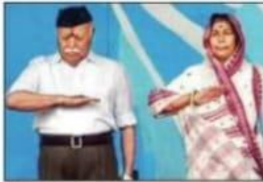
RSS chief Mohan Bhagwat with Santosh Yadav, the first woman to climb Everest twice, at the RSS HQ in Nagpur on Wednesday

Speaking at a Vijaya DASHAMI event to mark the Sangh’s foundation day.