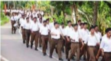
കോട്ടയം അതിർത്തി പാലം മുൻപായി നടത്തിയ പബ്ലിക് മീറ്റിംഗ്