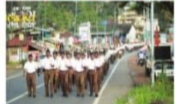
മുണ്ടലി അതിർത്തി പാലം

മുണ്ടലി അതിർത്തി പാലം മുൻപായി നടത്തിയ പബ്ലിക് മീറ്റിംഗിൽ പങ്കെടുത്തവരുടെയും പങ്കെടുക്കാനാവാതെ പോയവരുടെയും അഭിപ്രായങ്ങൾ കേൾക്കുന്ന പബ്ലിക് മീറ്റിംഗ്. ഇതിൽ പങ്കെടുത്തവരുടെയും പങ്കെടുക്കാനാവാതെ പോയവരുടെയും അഭിപ്രായങ്ങൾ കേൾക്കുന്ന പബ്ലിക് മീറ്റിംഗ്. ഇതിൽ പങ്കെടുത്തവരുടെയും പങ്കെടുക്കാനാവാതെ പോയവരുടെയും അഭിപ്രായങ്ങൾ കേൾക്കുന്ന പബ്ലിക് മീറ്റിംഗ്.