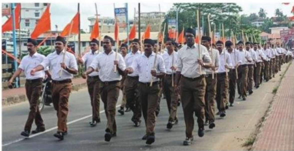
മുവാറ്റുപുഴയിൽ നടന്ന പമസഞ്ചലനം

സ്ത്രീകളും കുട്ടികളുമടങ്ങുന്ന വൻ സദസ്യം പതിപാടികൾ കാണാനെത്തിയിരുന്നു. തുടർന്ന് കായികപ്രദർശനം, തീരം, പ്രാർത്ഥന, ധ്യാനരോഹണവും അവരോഹണവും നടന്നു. കേന്ദ്ര സുരക്ഷാ സേനാംഗങ്ങളും, കൂടാതെ പൊലീസിന്റെയും ശക്തമായ സാന്നിദ്ധ്യവുമുണ്ടായിരുന്നു.