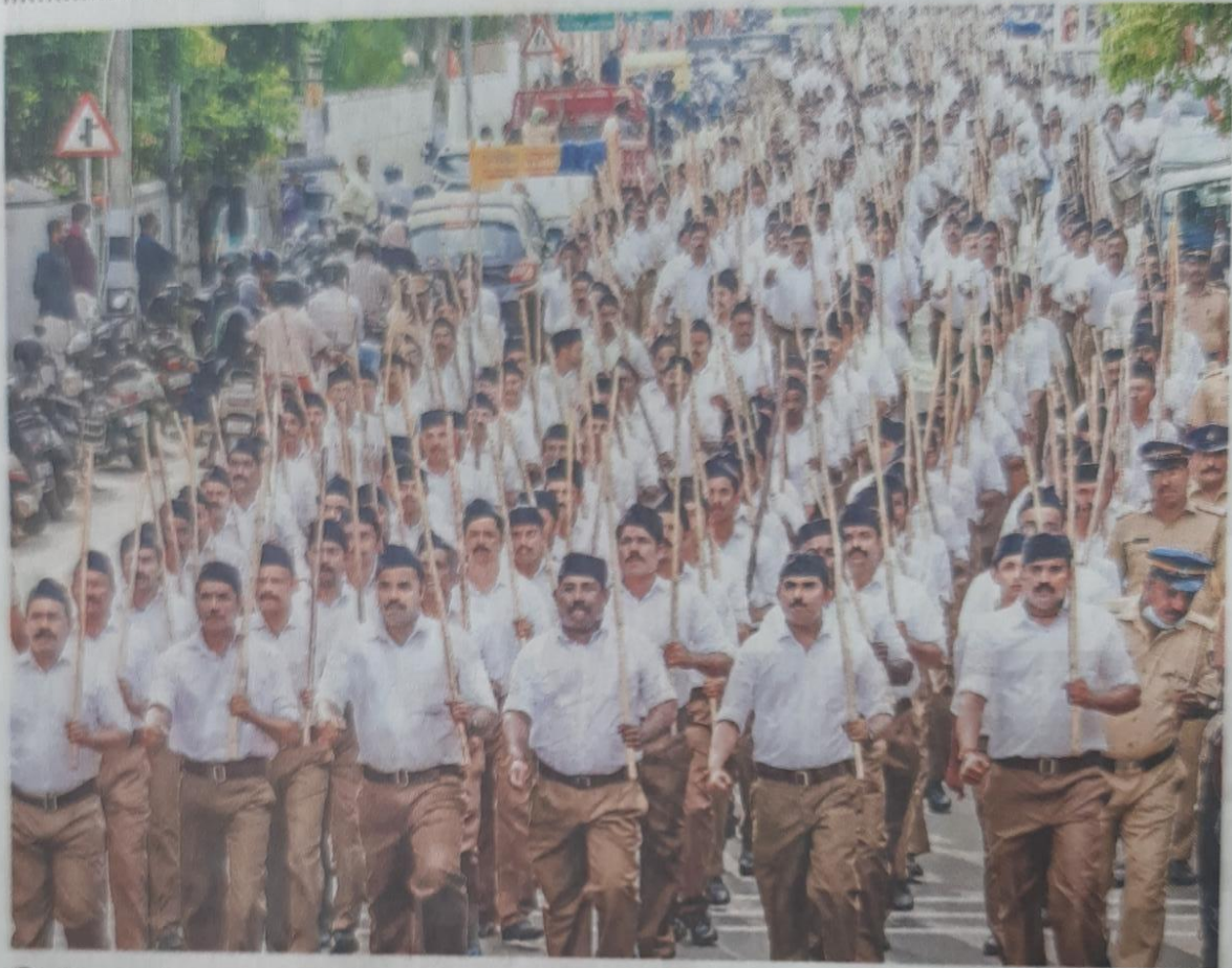
വിജയദശമിയോടനുബന്ധിച്ച് ആർ.എസ്.എസിന്റെ നേതൃത്വത്തിൽ നടത്തിയ നഗരത്തിൽ നടന്ന പഥസഞ്ചലനം