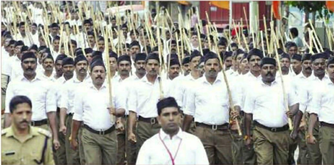
• ആർ.എസ്.എസ്. സ്മാപകദിനത്തോടനുബന്ധിച്ച് കോഴിക്കോട് നഗരത്തിൽ നടന്ന പദസഞ്ചലനത്തിന്റെ മുൻനിര.