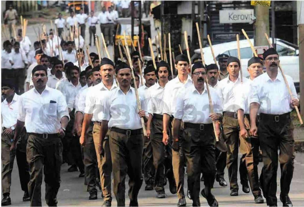
വിജയശക്തി ഉത്സവത്തിന്റെ ഭാഗമായി ആർ.എസ്.എസ് കണ്ണൂരിൽ നടത്തിയ പാദസഞ്ചലനം.

KERALA KAUMUDI EPAPER Clipping Kerala Kaumudi - Kannur