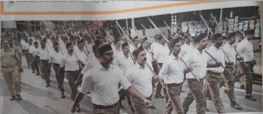
വിജയദശമിയോട് അനുബന്ധിച്ച് രാഷ്ട്രീയ സ്വയം സേവക സംഘം കോഴിക്കോട് നടത്തിയ പഥസഞ്ചലനം.

പഥസഞ്ചലനം പുഷ്പ ജങ്ഷനിൽ സംഗമിച്ച് ആഴ്വട്ടം വഴി മാങ്കാവ് മൈതാനിയിൽ സമാപിച്ചു. തുടർന്ന് യോഗ, വ്യായാമ് യോഗ്, ദണ്ഡ, നിയുദ്ധ, സമത തുടങ്ങിയ ശാരീരിക പ്രദർശനവും ഗണഗീതവും നടന്നു. മുവായിരത്തിലധികം സ്വയം സേവകർ പഥ സഞ്ചലനത്തിലും മറ്റ് പരിപാടികളിലും പങ്കെടുത്തു.