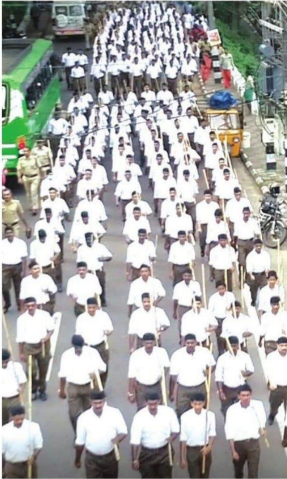
വിജയനഗരി ആഘോഷത്തോടനുബന്ധിച്ച് ആർഎസ്എസ് കോഴിക്കോട് ജനാനന്തരിന്റെ ആഭിമുഖ്യത്തിലുള്ള പരസമ്മേളനം