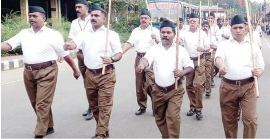
▶ ആർ.എസ്.എസ്. എരുമേലി താലൂക്ക് വിഭാഗിന്റെ നേതൃത്വത്തിൽ എരുമേലിയിൽ നടന്ന പാസഞ്ചലനം