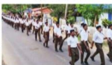
കോട്ടയം അതിർത്തി പാലം മുൻപായി നടത്തിയ പബ്ലിക് മീറ്റിംഗ്

മുണ്ടലി അതിർത്തി പാലം മുൻപായി നടത്തിയ പബ്ലിക് മീറ്റിംഗിൽ പങ്കെടുത്തവരുടെയും പങ്കെടുക്കാനാവാതെ പോയവരുടെയും അഭിപ്രായങ്ങൾ കേൾക്കുന്ന പബ്ലിക് മീറ്റിംഗ്. ഇതിൽ പങ്കെടുത്തവരുടെയും പങ്കെടുക്കാനാവാതെ പോയവരുടെയും അഭിപ്രായങ്ങൾ കേൾക്കുന്ന പബ്ലിക് മീറ്റിംഗ്.