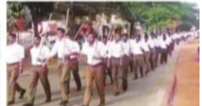
കോട്ടയം അതിർത്തി പാലം