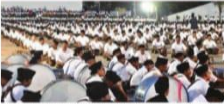
വൈക്കത്ത് മഹാസഞ്ചലനത്തിന് ആദ്യമായി പങ്കെടുത്തവരുടെയും പങ്കെടുക്കാനാവാതെ പോയവരുടെയും അഭിപ്രായങ്ങൾ കേൾക്കുന്ന പബ്ലിക് മീറ്റിംഗ്