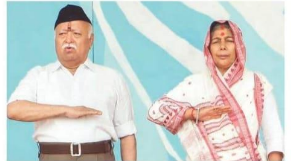
ആർ.എസ്.എസ്. ഭരണിനതന്ത്രസമന്വയിച്ച നാടുകളിൽ നടന്ന വിജയദശമി പരിപാടിയിൽ സർ സംഘപാലക് ഡോ. മോഹൻ ഭാഗവതും ചടങ്ങിൽ വിശിഷ്ടമായി പങ്കെടുത്ത എറണാകുളം മുഖ്യമന്ത്രി കിഴക്കിന്ദ്ര പ്രശസ്ത പർവതാരാധക സന്യാസി യോഗ്യം.

In June, he had also tried to rein in the saffron zealots not to "look for a Shivering in every mosque (har masjid me Shivling kyun dekhna)." This statement was made as the controversy over the Gyanvapi mosque raged. In a nutshell, Bhagwat should avoid making statements which may further anger the excitable saffron enthusiasts. As it is, their words and actions have had a chilling effect on Muslims. Government machinery, especially those who are expected to uphold the law, doesn't make things easier. A video doing the rounds on social media is that of cops in full public view thrashing a few men, said to be Muslims, in Gujarat's Kheda district. The men, who allegedly attacked a Garba event, were held against an electric pole in the village square and beaten. Worse, the cops were cheered on by the onlookers. Human dignity, civil rights, innocent until proven guilty, the rule of law—such concepts seem to be vanishing. The RSS website talks about "keeping aflame the spirit of freedom." Accordingly, it should condemn the Kheda incident. Also, it must regularly focus on such real issues as inflation and unemployment, as its leader Dattatreya Hosabale did, instead of raising the bogeyman of growing Muslim population.