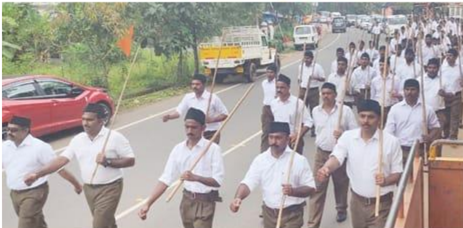
📌 ആർ.എസ്.എസ്.പൊൻകുന്നത്ത് നടത്തിയ വിജയദശമി പഥസഞ്ചലനം