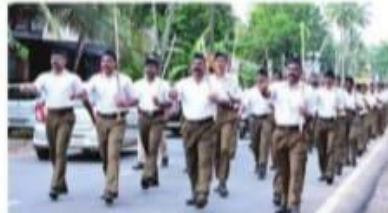
കോട്ടയം അതിർത്തി പാലം മുൻപായി നടത്തിയ പബ്ലിക് മീറ്റിംഗ്